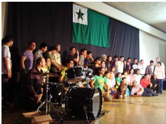
Foto 4. Grupa foto post "Arta Vespero" en la Casa de la Cultura Jalisciense.