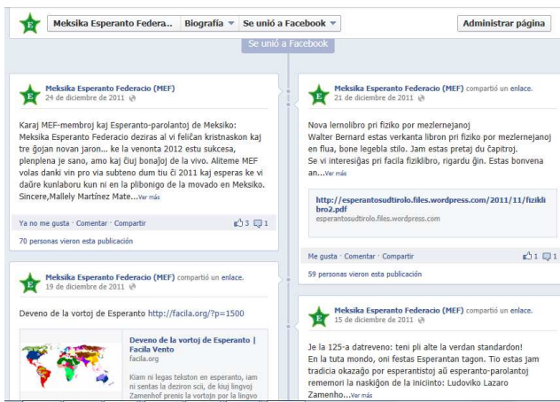
Bildo 2. Retpaĝo de MEF ĉe facebook, 2011

MEF ankaŭ profitas tiun paĝon por informi pri renkontiĝoj kaj novaĵoj. Kvankam la ĉefa lingvo uzata tie estas Esperanto, la partoprenantoj de tempo al tempo krokodilas sed ĉefe kun esperantaj celoj.