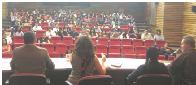
Foto 1. Informprelego antaŭ studentaro de la Jura Fakultato de UNAM