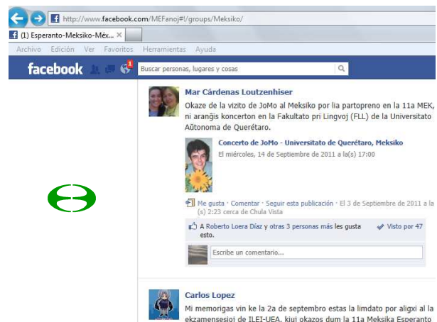
Bildo 3. Grupo ĉe facebook “Esperanto – Meksiko en 2011