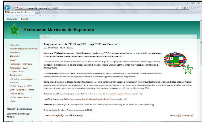
Bildo 1. Esperanta versio de la retpaĝo de MEF 2011, “Renkontiĝoj (internaciaj)”