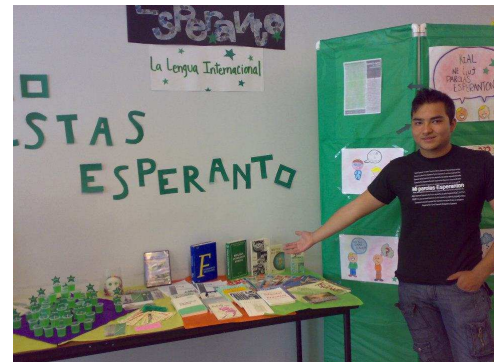
Foto 3. Aktivulo el Querétaro montrante la E-budon dum la Kultura semajno, en UAQ.

Indas menciigi ankaŭ ke aliaj membroj de la asocio kaj meksikaj aktivuloj disdonis flugfoliojn kaj informilojn en diversaj edukaj kaj kulturaj institucioj, tio signifas ke, la agado ne nur okazis en la supre menciitaj institucioj.